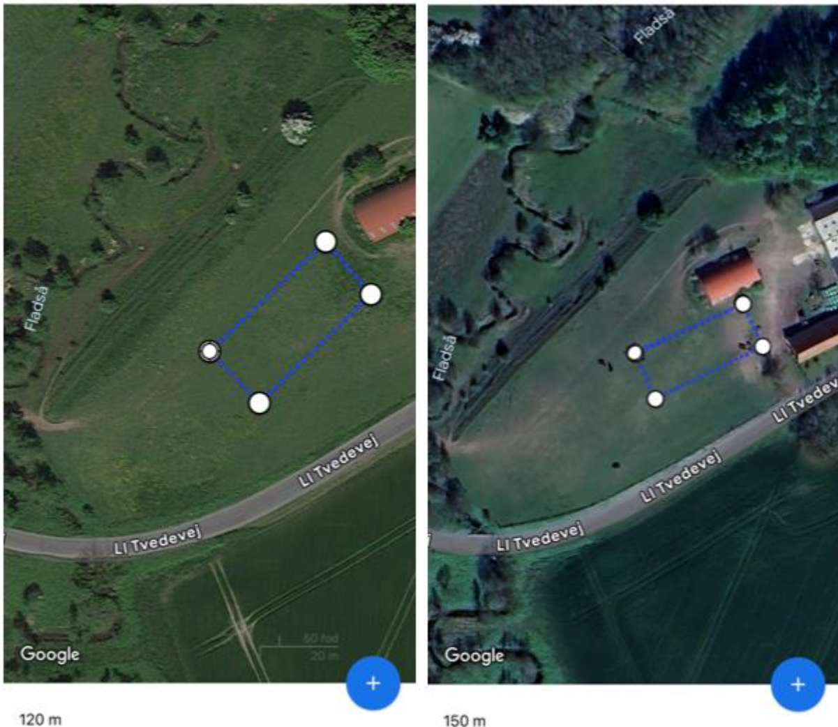
Situationsplaner fra ansøgningsmaterialet – til venstre ses den oprindelige placering og til højre ses den nye gældende placering.

Oprindeligt ansøgte du d. 11.02.2024 om placeringen til venstre nedenfor. Efter dialog med kommunen har du d. 05.04.2024 ansøgt om en ny placering. Det er den nye placering til højre nedenfor, som der gives landzonetilladelse til: